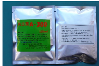
製品外観(1袋 100ml 液体) 冷蔵品